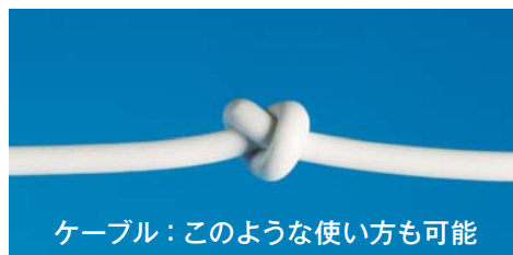
ケーブル：このような使い方も可能