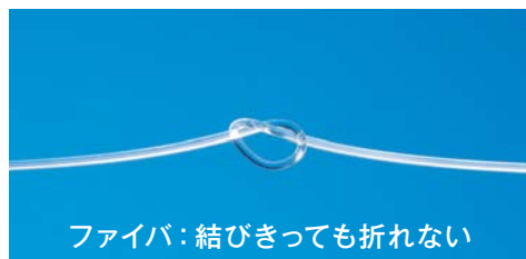
ファイバ：結びきっても折れない