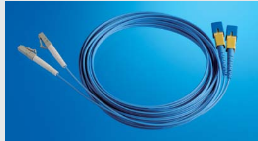
2心コネクタ付光ケーブル (製品例)