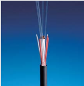
光電複合ケーブル (開発例)